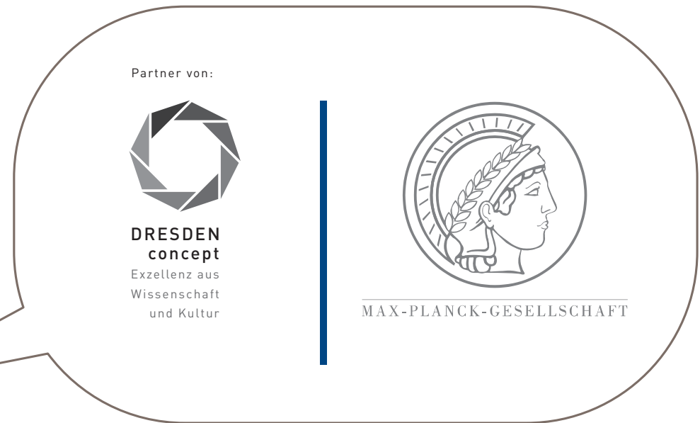
Integration des Marken-Zeichens in den bestehenden Briefbogen eines Netzwerkpartners