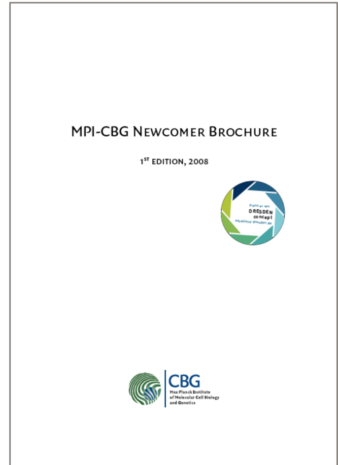
der Aufkleber in der Anwendung auf den unterschiedlichen Broschüren der Partner